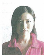
顔に影があるもの