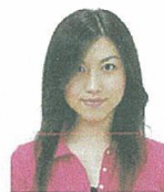
前髪が目元にかかっているもの