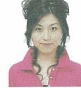
上部余白がないもの