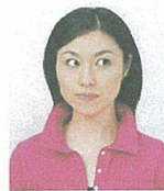
目線が正面でないもの