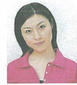
顔が左右に傾いているもの