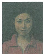
背景の色が濃く人物を特定できないもの