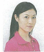
顔が横向きなもの