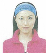
幅の広いヘアバンド等により頭部が隠れているもの