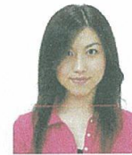
前髪が目元にかかっているもの