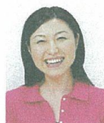
平常の顔貌と著しく異なるもの