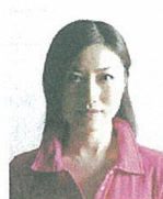
顔に影があるもの