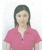
上三分身より小さいもの