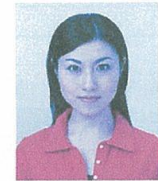
著しく変色しているもの