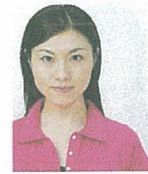
顔が左右に寄っているもの