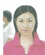
人物が写り込んでいるもの