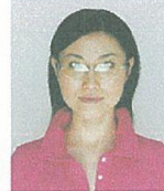
照明が眼鏡に反射したものの