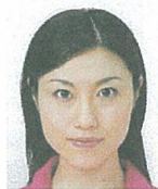
上三分身より大きいもの