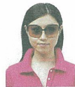
サングラスをかけているもの