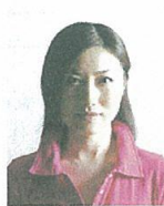
顔に影があるもの