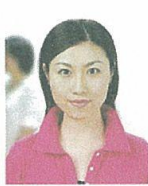
人物が写り込んでいるもの