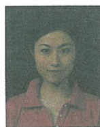
背景の色が濃く人物を特定できないもの