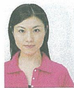
顔が左右に寄っているもの