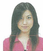
前髪が目元にかかっているもの