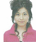
上部余白がないもの