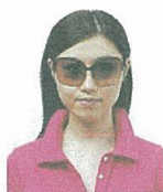
サングラスをかけているもの