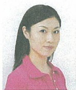
顔が横向きのもの