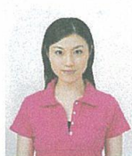
上三分身より小さいもの