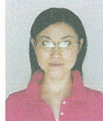
照明が眼鏡に反射したものの